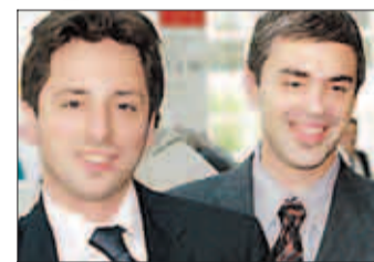
Google-Gründer Larry Page (re.) und Sergey Brin haben Schwierigkeiten mit Werbung in den Suchergebnissen

Experten meinen, daß Microsoft mit seiner neuen Suchmaschine Google eingeholt hat. Technisch auf jeden Fall, heißt es in der aktuellen Ausgabe der Wissenschaftszeitschrift New Scientist. Doch es werde dauern, bis sich die Microsoft-Suche auch beim Publikum durchsetzt – Jahre. Trotzdem ist dem Google-Management klar, daß die kometenartige Entwicklung des Unternehmens sich nicht in alle Ewigkeit fortsetzen wird. In einer